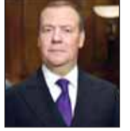
रूस ने अमेरिका और इजराइल से ईरान में तुरंत हमले रोकने की अपील की। रूसी विदेश मंत्रालय ने कहा कि उन्हें मौजूदा स्थिति से राजनीतिक और कूटनीतिक समाधान के रास्ते पर लौटना चाहिए। रूस पहले की तरह अंतरराष्ट्रीय कानून, आपसी सम्मान और हितों के संतुलन के आधार पर शांतिपूर्ण समाधान खोजने के प्रयासों में सहयोग देने के लिए तैयार है। रूस के पूर्व राष्ट्रपति दिमित्री मेद्वेदेव ने अमेरिका पर तंज करते हुए कहा कि शांति दूत फिर सक्रिय हो गया है। ईरान के साथ बातचीत सिर्फ एक बहाना था। यह सबको पता था।