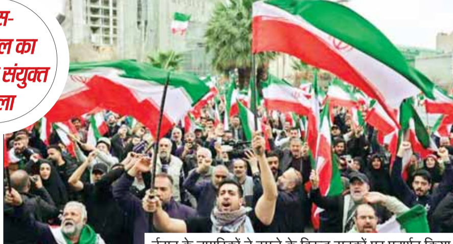
ईरान के नागरिकों ने हमले के विरुद्ध सड़कों पर प्रदर्शन किया