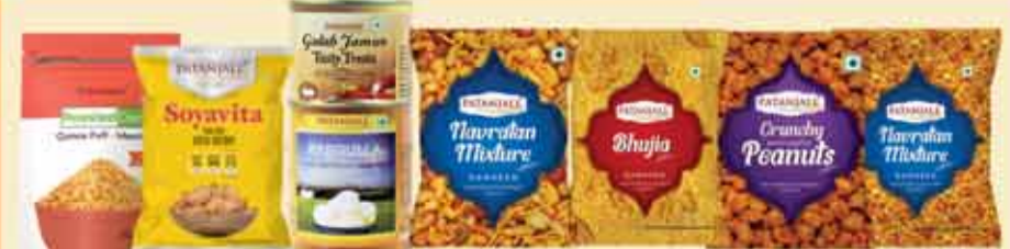
स्वीट्स एवं स्नेक्स