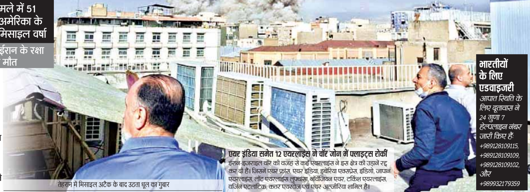
तेहरान में मिसाइल अटैक के बाद उड़ता धूल का गुबार

खाड़ी देशों ने बंद किया एयरस्पेस, तेल संकट गहराने की आशंका