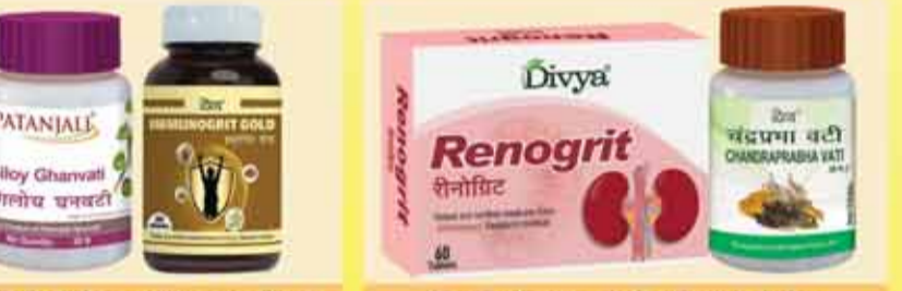
किडनी प्रॉब्लम्स को रिवर्स करने के लिए