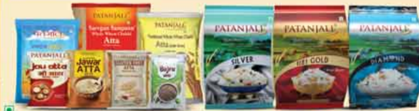
पतंजलि के आटा रेंज एवं पतंजलि चावल रेंज

नोट- पतंजलि के मल्टीग्रेन आटा व कुछ विशिष्ट 1 हजार प्रोडक्ट्स पतंजलि एक्सक्लूसिव स्टोर्स पर ही उपलब्ध हैं।