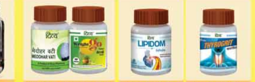
ओबेसिटी के लिए अचूक औषधि कोलेस्ट्रॉल के लिए थायरॉइड के लिए

चिकित्सा के परामर्श के लिए अपने नजदीकी पतंजलि चिकित्सालय पर अवश्य विजिट करें।