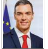
स्पेन के पीएम पेद्रो सांचेज ने अमेरिका और इजराइल की सैन्य कार्रवाई को एकतरफा कदम बताया है। सांचेज ने कहा कि ऐसी कार्रवाई वैश्विक व्यवस्था को और अस्थिर तथा टकरावपूर्ण बना सकती है। हालांकि उन्होंने ईरान सरकार और रिजोल्यूशनरी गार्ड की गतिविधियों को भी स्वीकार नहीं बताया। स्पेन ने सभी पक्षों से तुरंत तनाव कम करने और अंतरराष्ट्रीय कानून का पूरी तरह सम्मान करने की मांग की है। उन्होंने जोर देकर कहा कि मौजूदा संकट का समाधान केवल कूटनीतिक बातचीत और शांतिपूर्ण रास्ते से ही संभव है।