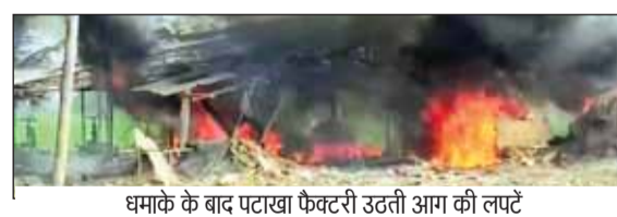
धमाके के बाद पटाखा फैक्टरी उठती आग की लपटें

आंध्र प्रदेश पटाखा फैक्टरी में धमाका 21 लोगों की मौत, आठ लोगों की हालत गंभीर