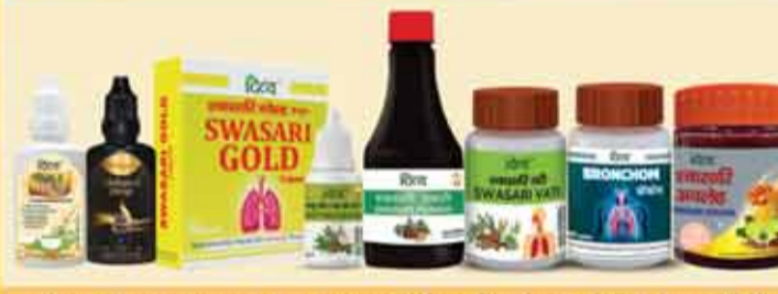
ब्रोंकाइटिस, अस्थमा, कफ, कोल्ड के लिए रिसर्च एवं एविडेन्स बेस्ड मेडिसिन