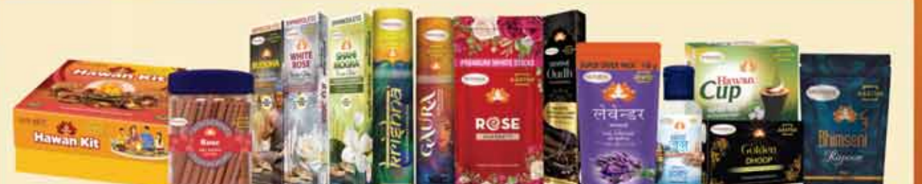
धूप-अगरबत्ती के नाम पर बहुत भयंकर मिलावट है तथा 100% पवित्रता बॉस रहित अगरबत्ती, भीमसेनी कपूर, शुद्धतम तिल तेल, हवन सामग्री आदि से अपने इष्ट का पूजन करें।