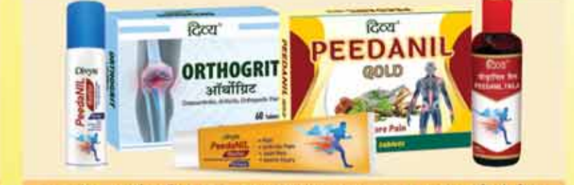
वात रोग, आर्थराइटिस, RA, CRP, AVN, ANA, HLA-B27 आदि के लिए