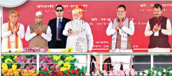
एचपीवी टीकाकरण कार्यक्रम का शुभारंभ करते प्रधानमंत्री मोदी