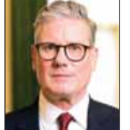
ब्रिटेन के अमेरिका और इजराइल द्वारा ईरान पर किए गए हमलों में भाग नहीं लिया। हमारी तत्काल प्राथमिकता इस क्षेत्र में मौजूद बिटेन के नागरिकों की सुरक्षा है, जिन्हें चौबीसों घंटे सातों दिन राजनयिक सहायता प्रदान की जाएगी।

ब्रिटेन के पीएम कीर स्टारमर ने कहा कि ईरान को कभी भी परमाणु हथियार विकसित करने की अनुमति नहीं दी जानी चाहिए और इसीलिए हमने बातचीत के जरिए समाधान तक पहुंचने के प्रयासों का लगातार समर्थन किया है। हम नहीं चाहते कि यह मामला और बढ़कर एक व्यापक क्षेत्रीय संघर्ष में तब्दील हो जाए।