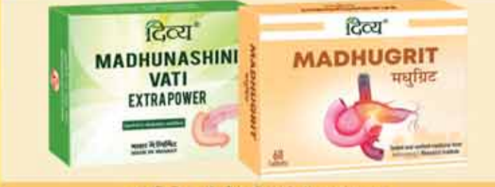
खयबिटीज को रिवर्स करने में लाभदायक