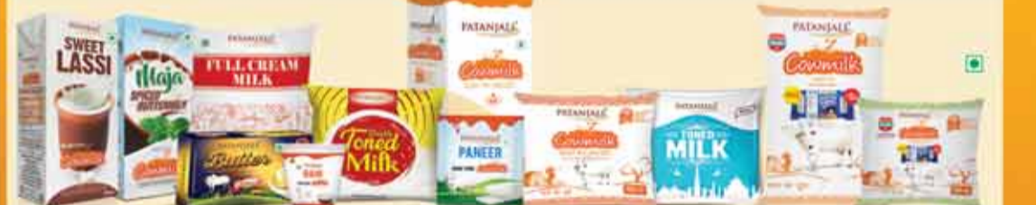
दिल्ली एनसीआर, उत्तराखण्ड, राजस्थान व महाराष्ट्र में पतंजलि के डेयरी प्रोडक्ट्स उपलब्ध हैं।

नोट- पतंजलि के मल्टीग्रेन आटा व कुछ विशिष्ट 1 हजार प्रोडक्ट्स पतंजलि एक्सक्लूसिव स्टोर्स पर ही उपलब्ध हैं।