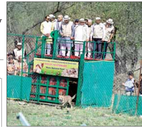
भूपेंद्र यादव चीतों को क्वारंटीन बाड़े में छोड़ते हुए

केंद्रीय मंत्री यादव ने कहा कि कूनो में जिस तेजी के साथ चीता प्रजनन बढ़ा है, उससे कूनो सिर्फ चीता बसाहट वाला वन्य जीव अभयारण्य ही नहीं रहा, बल्कि वह दूसरे वन्य जीव अभयारण्य को चीता देने वाला बन गया है। उन्होंने कहा कि बायोडायवर्सिटी कंजर्वेशन की दिशा में कई देश साथ आए हैं। कूनो नेशनल पार्क में चीतों का कुलबा निरंतर बढ़ रहा है, वर्तमान में भारत में चीतों की संख्या 48 हो गई है, जिनमें 45 कूनो नेशनल पार्क और 3 गांधी सागर अभयारण्य में हैं। उन्होंने कहा कि भारत के प्रयासों से विश्व में जैव विविधता संरक्षण के लिए कार्य किया जा रहा है और 97 देश इस मंच के सदस्य बन गए हैं।