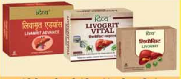
फैटी लिवर, लिवर सिरोसिस, हेपेटाइटिस आदि को रिवर्स करने के लिए