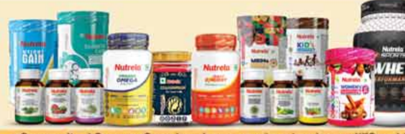
बहिष्कार करें- केमिकल व एनिमल बेस्ड प्रोडक्ट्स का और न्यूट्रला नेचुरल ऑर्गेनिक प्रोटीन, विटामिन्स, ओमेगा आदि अपनाएं