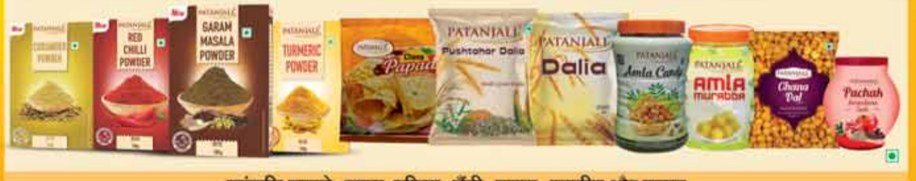
पतंजलि मसाले, पापड़, दलिया, कैंडी, मुरब्बा, नमकीन और पाचक

भारत एक ऋषि एवं कृषि प्रधान देश है। इसलिए उच्चतम श्रेणी के पशु आहार एवं फूड सप्लीमेंट्स।