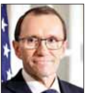
नॉर्वे के विदेश मंत्री एस्पेन बार्थ ने कहा कि इजराइल के हमले अंतरराष्ट्रीय कानून के अनुरूप नहीं हैं। इजराइल इसे एहतियात के तौर पर किया गया हमला बना रहा है। लेकिन अंतरराष्ट्रीय कानून के तहत एहतियात के तौर पर हमले तभी सही माने जाते हैं, जब खतरा तुरंत और स्पष्ट रूप से सामने हो।