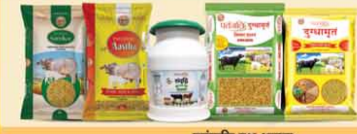
पतंजलि पशु आहार

लगभग 1 करोड़ स्टोर्स पर पतंजलि के प्रोडक्ट्स उपलब्ध हैं। फिर भी कोई प्रोडक्ट स्टोर पर उपलब्ध नहीं है तो आप दुकानदार से इसकी डिमाण्ड करें, वो इसे उपलब्ध करायेंगे।