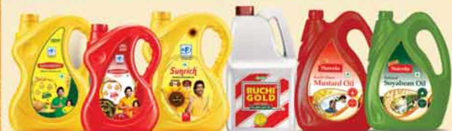
महाकोश, सनरिच, रुची गोल्ड देश का नं. 1 पाल्म ऑयल ब्राण्ड एवं न्यूट्रला ऑयल रेंज