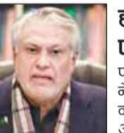
हम ईरान के साथ: पाकिस्तान

पाकिस्तान के विदेश मंत्री इशक डार ने ईरान पर हुए हमलों की आलोचना की। उन्होंने तनाव को तुरंत रोकने और संकट के शांतिपूर्ण, बातचीत के जरिये समाधान के लिए देबारा कूटनीति शुरू करने की अपील की और कहा कि पाकिस्तान का पूरा समर्थन ईरान के साथ है।