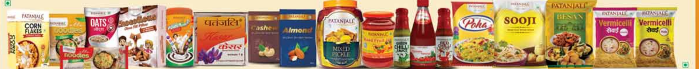
पतंजलि हेल्दी एवं न्यूट्रिशियस फूड प्रोडक्ट्स, पावर वीट, केसर व ड्राईफ्रूट्स, अचार, जेम व सॉस, पोहा, सूजी, बेसन, सेवई