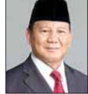
इंडोनेशिया के विदेश मंत्री ने कहा कि राष्ट्रपति प्रबोवो सुबियांतो वाशिंगटन और तेहरान के बीच संवाद करने के लिए तैयार हैं। अमेरिका और ईरान के बीच बातचीत विफल होने से पश्चिम एशिया में सैन्य तनाव बढ़ा है, जिस पर इंडोनेशिया को बेहद अफसोस है। इंडोनेशिया ने सभी पक्षों से संयम बरतने और संवाद व कूटनीतिक को प्राथमिकता देने की अपील की है।