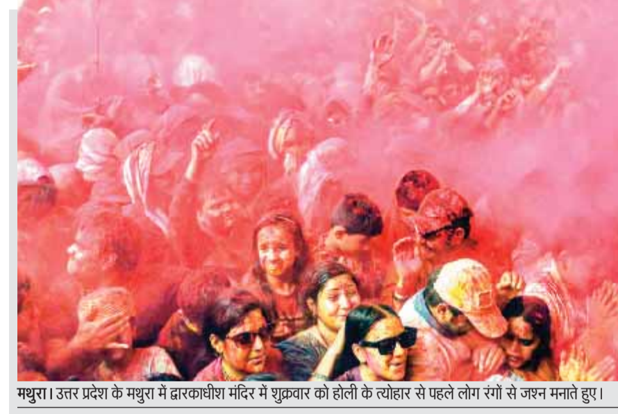
मथुरा। उत्तर प्रदेश के मथुरा में द्वारकाधीश मंदिर में शुक्रवार को होली के त्योहार से पहले लोग रंगों से जश्न मनाते हुए।