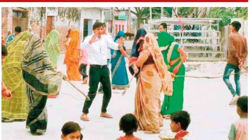
व्या होता है पैना

पैना लकड़ी की छड़ी में चमड़े की पट्टी बांधकर बनाया जाने वाला पारंपरिक औजार है, जिसका उपयोग पुराने समय में बैलों को हॉकने के लिए किया जाता था। लेकिन, फिरोजाबाद के इस गांव में बैलों को हॉकने का यह औजार होली का खिलौना बन जाता है।