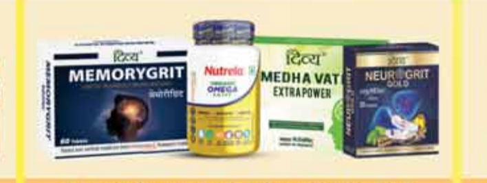
ब्रेन, नर्वस सिस्टम व मेमोरी के लिए सर्वश्रेष्ठ औषधियाँ