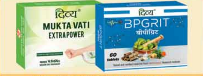
हाई बी. पी. को प्राकृतिक रूप से निर्मूल करने के लिए।

अर्थ से परमार्थ व राष्ट्रसेवा (Prosperity for Charity): PFL को प्राप्त होने वाला सम्पूर्ण लाभ, पतंजलि गुरुकुलम्, भारतीय शिक्षा बोर्ड, आचार्यकुलम्, पतंजलि विश्वविद्यालय, रिसर्च फाउंडेशन, विकित्सा, शिक्षा, वृक्षारोपण, सनातन धर्म और भारत माता की सेवा में पूर्णतः समर्पित किया जाता है। इस प्रकार लाभ का 100% भाग निःस्वार्थ चैरिटी और राष्ट्रसेवा के कार्यों में लगाया जाता है। पूजनीय स्वामी रामदेव जी का संकल्प है कि अपने अंतिम श्वास तक हम पवित्रता और प्रामाणिकता के साथ भारत माता की सेवा करते रहेंगे तथा एक स्वस्थ, समृद्ध और परम वैभवशाली भारत के निर्माण में अपना योगदान देते रहेंगे। पूजनीय आचार्य बालकृष्ण जी कई वर्षों से विश्व के शीर्ष 2% वैज्ञानिकों और अनुसंधानविदों की श्रेणी में सम्मिलित हैं। उनके दृष्टिकोण से पतंजलि विज्ञान, अनुसंधान और स्वदेशी नवाचार के माध्यम से वैश्विक मानचित्र पर अग्रणी ब्रांड बन रहा है। योग, आयुर्वेद, स्वदेशी, सनातन धर्म की सेवा में आज पतंजलि भारत के श्रेष्ठतम संस्थान के रूप में कार्यरत है।