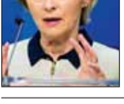
यूरोपीय आयोग (ईयू) की अध्यक्ष उर्सुला वॉन डेर लैयेन और यूरोपीय परिषद के अध्यक्ष एंटोनियो कोस्टा ने ईरान से जुड़े घटनाक्रम पर गहरी चिंता जताई है। सभी पक्षों से अधिकतम संयम बरतने, नागरिकों की सुरक्षा सुनिश्चित करने और अंतरराष्ट्रीय कानून का पालन करने की अपील की गई। यूरोपीय संघ ने कहा कि क्षेत्र में मौजूद अपने नागरिकों की सुरक्षा के लिए जरूरी कदम उठाए जाएंगे।