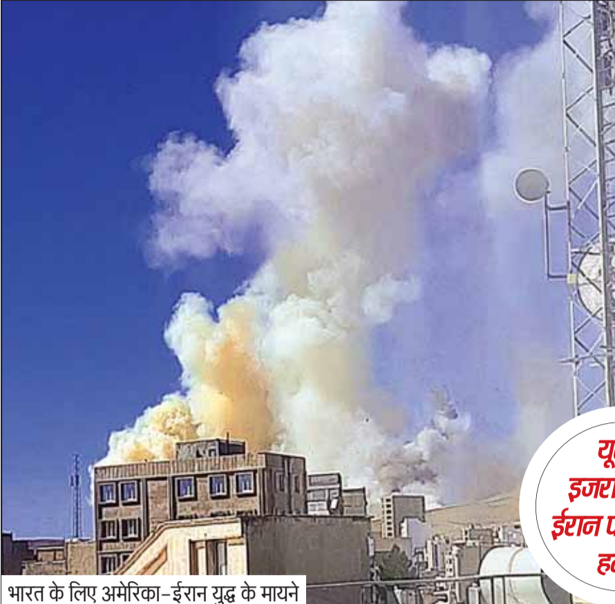
भारत के लिए अमेरिका-ईरान युद्ध के मायने

◆ रूस का तंज, शांति दूत फिर सक्रिय हुआ। ◆ ब्रिटेन बोला- ईरान को कभी भी परमाणु ईरान के साथ बातचीत सिर्फ एक बहाना था हथियार विकसित करने की अनुमति नहीं दें